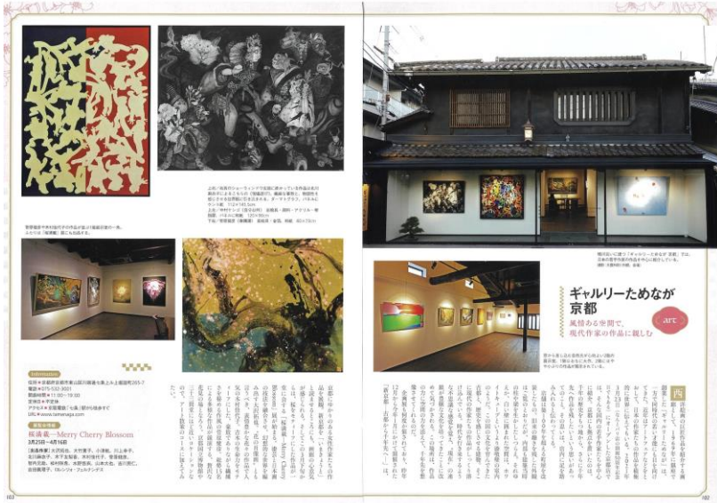
ギャラリーためなが京都様