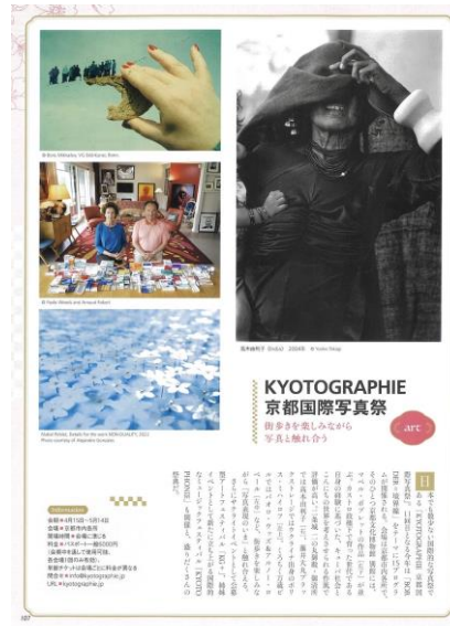
京都国際写真展様