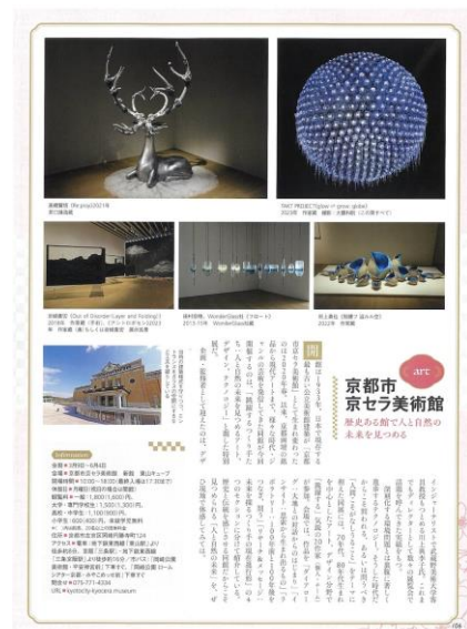
京都市京セラ美術館様