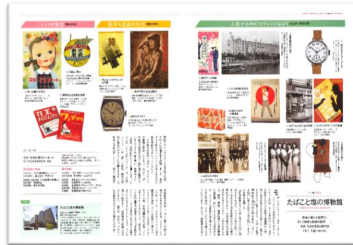
2018年5月号掲載 「たばこと塩の博物館」様