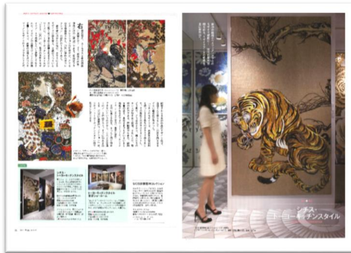
2018年5月号掲載 「トーヨーキッチン」様