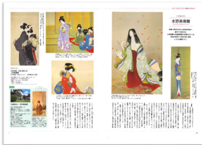
2018年5月号掲載 「水野美術館」様