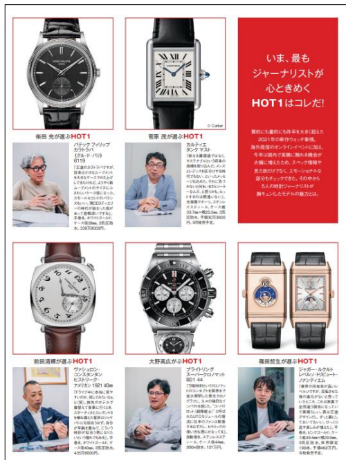
▲ ジャーナリストによる時計トレンド解説のイメージ

本特集では、この5つのテーマに沿って、各ブランドのお勧め時計、または各時計店をご紹介します。