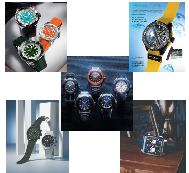
▲ 5つのテーマのイメージ