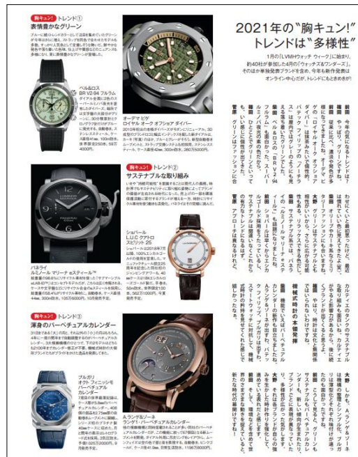
▲ 時計カテゴリー分析のイメージ