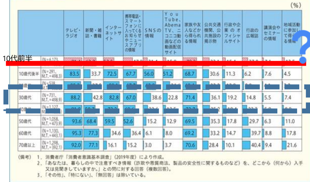
図表I-1-6-28 注意すべき情報の入手先 (%)