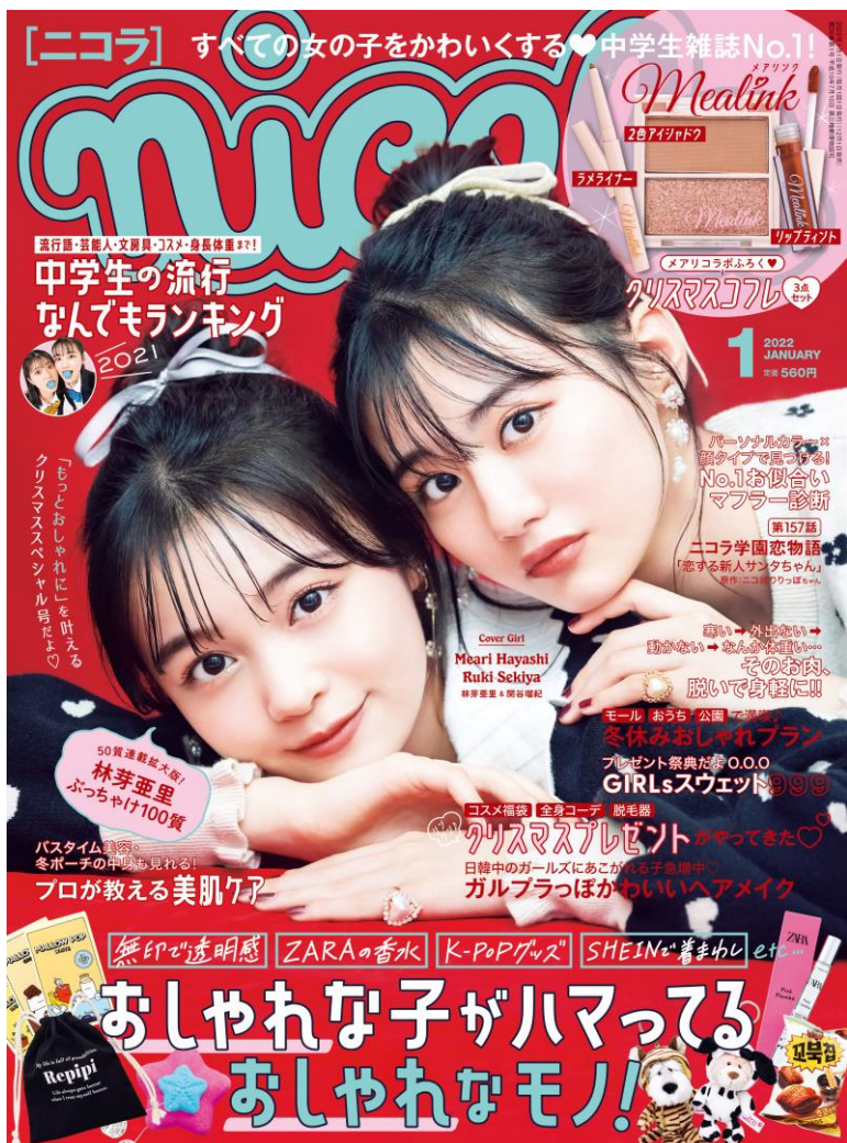
日本ABC協会実売考査部数：74,310部（2020年7～12月）

2022年に25周年を迎える（1997年創刊）、おしゃれに興味を持つ中学生の女の子を対象としたライフスタイル&ファッション誌。 ニコラの専属モデルは通称「ニコ㊦」と呼ばれ、同世代のカリスマとして人気を集めており、絶大な影響力を持っています。誌面だけでなく、SNSなども活用し立体的に情報を発信中です。