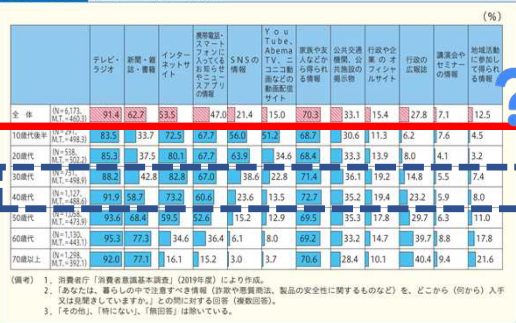
図表I-1-6-28 注意すべき情報の入手先 (%)