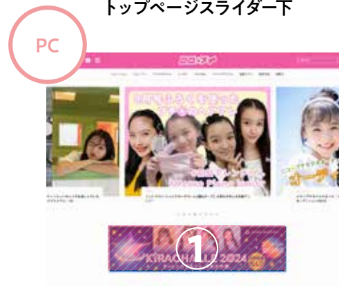
(1) PC、SP の トップページスライダー下