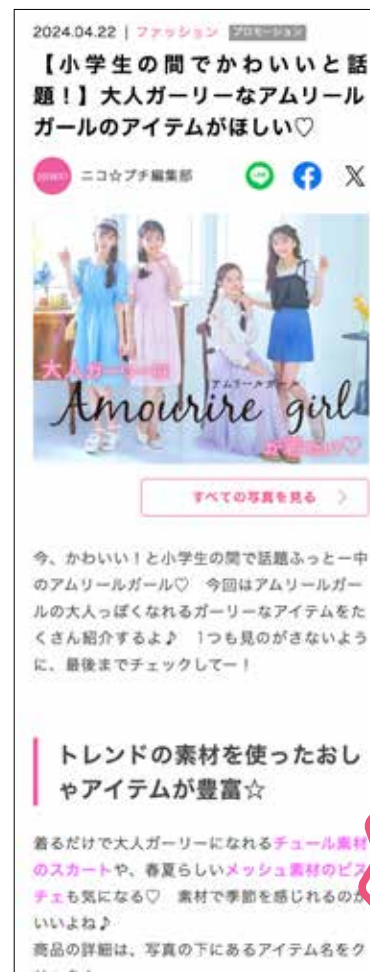
本誌転載 (イメージ)